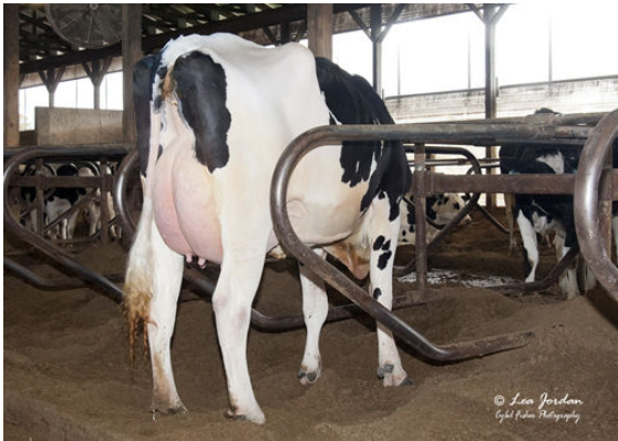
OCD BURLEY FRANCES 41330 DAM