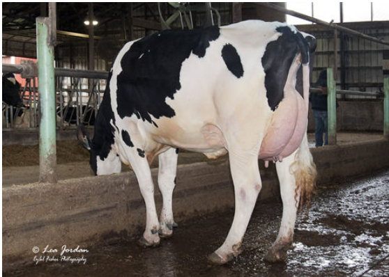
OCD BURLEY FRANCES 41330 DAM